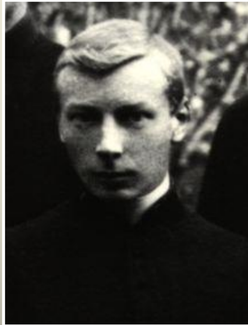
Kleryk – Wyszyński w 1920 r.