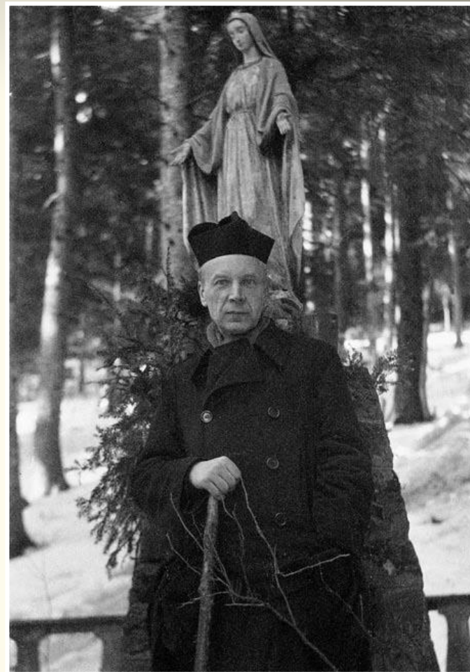
Podczas uwięzienia w Komańczy w 1956 roku