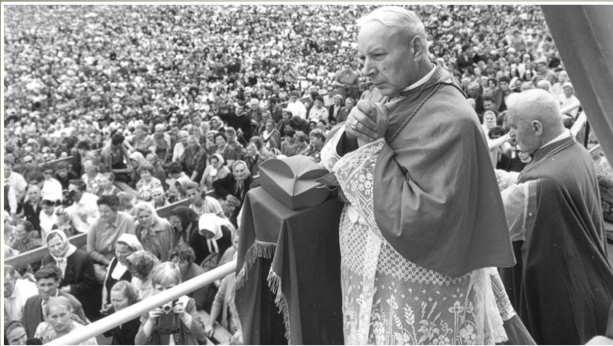
Obchody Milenium Chrztu Polski w 1966 r.