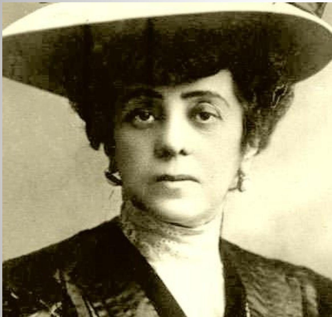
Gabriela Zapolska (1857-1921)