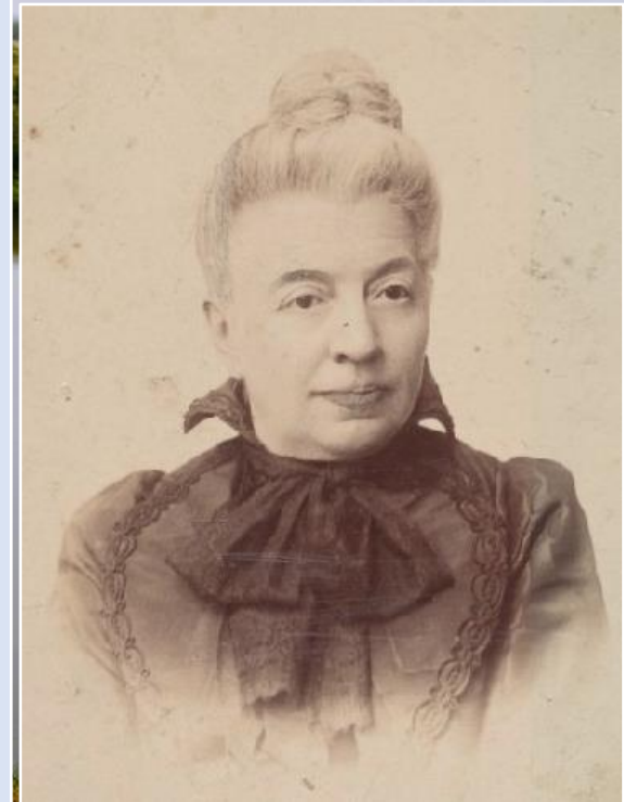
Eliza Orzeszkowa [1899]

W 1905 roku Eliza Orzeszkowa była nominowana do Nagrody Nobla w dziedzinie literatury. W 1906 roku otrzymała pierwszą nagrodę Fundacji Franciszka Kochmana ze Lwowa. Zmarła 18 maja 1910 r. w Grodnie po ciężkiej chorobie serca.