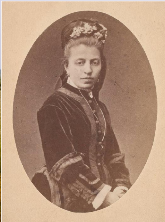
Eliza Orzeszkowa [ok. 1865]